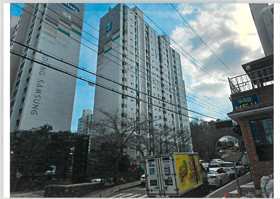
본건 전경(북서측에서 촬영)