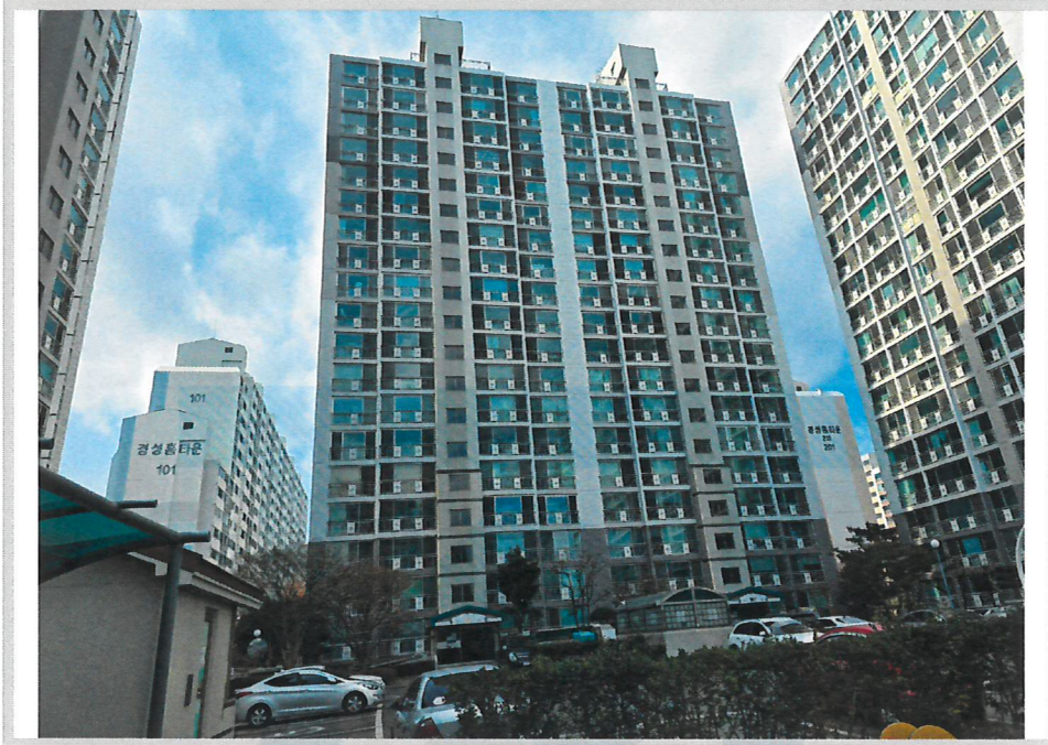
본건 전경(남동측에서 촬영)