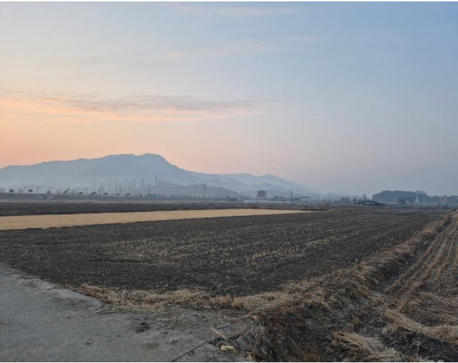
대상물건 전경 (북서측)