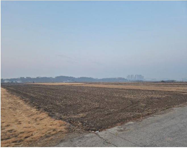
대상물건 전경 (북동측)