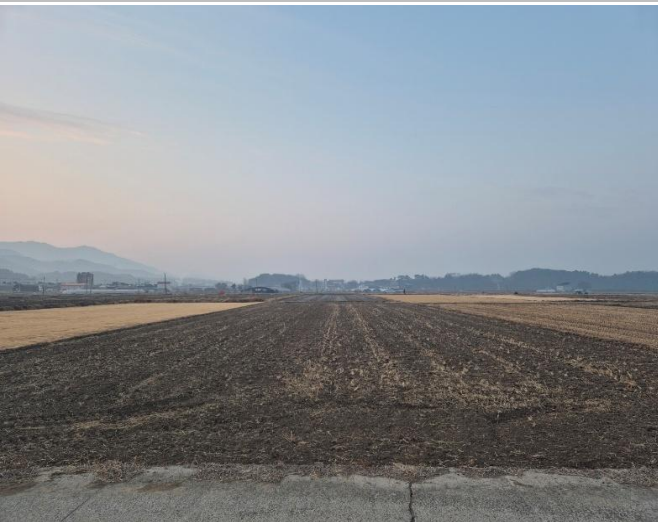
대상물건 전경 (북측)