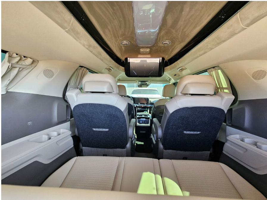
차량 내부 (트렁크쪽에서 촬영)