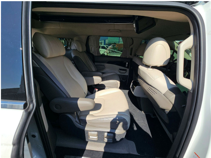
차량 내부 (2열)