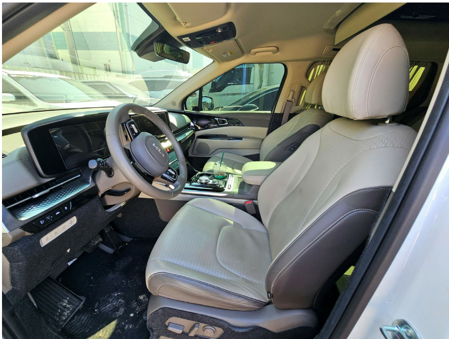
차량 내부 (1열)