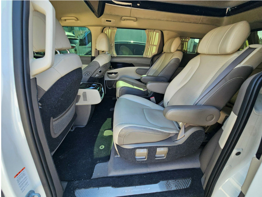
차량 내부 (2열)