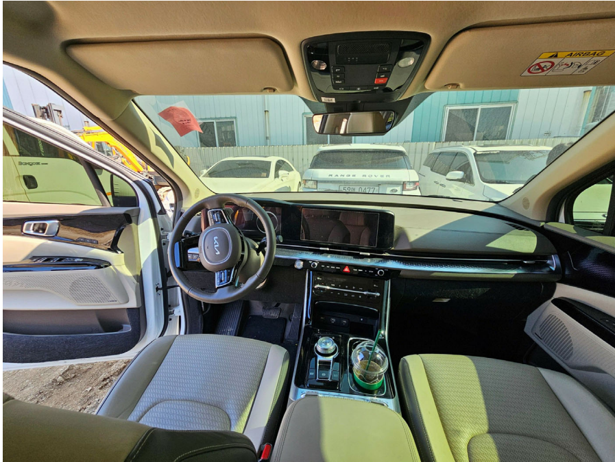
차량 내부 (1열)