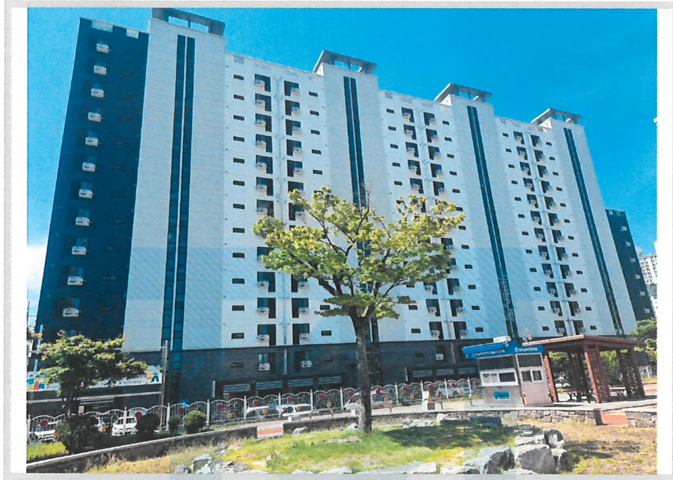
본건 전경(북동측에서 촬영)