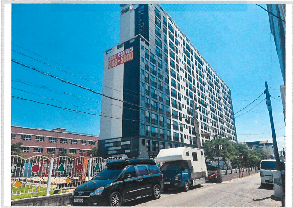
본건 전경(남서측에서 촬영)