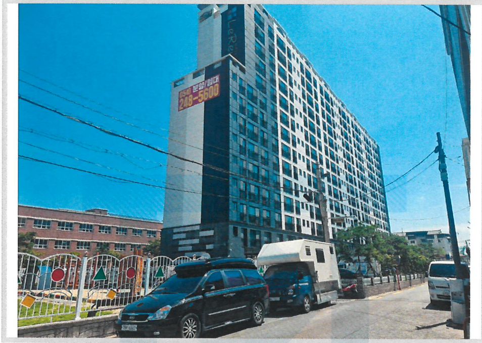
본건 전경(남서측에서 촬영)