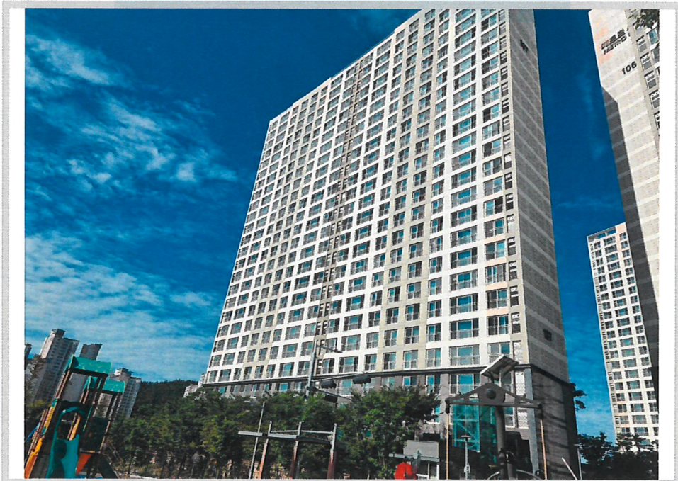
본건 전경(북동측에서 촬영)