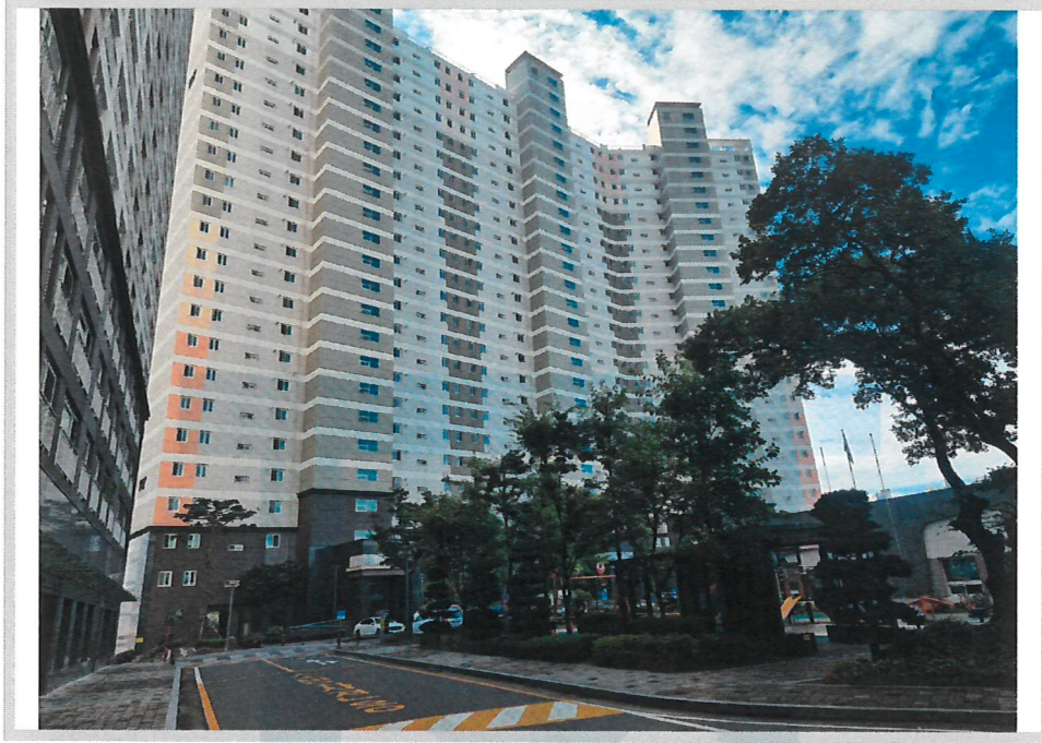
본건 전경(북서측에서 촬영)