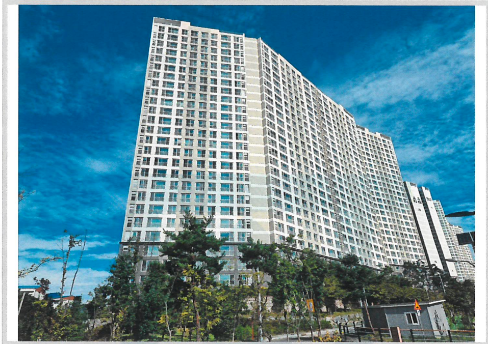
본건 전경(남동측에서 촬영)