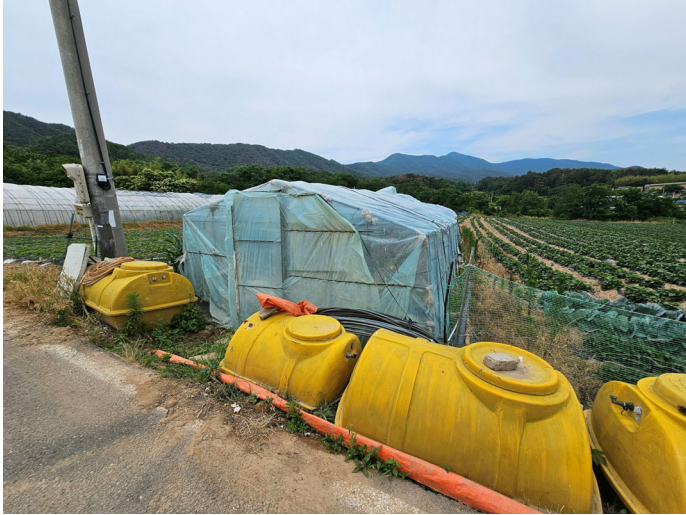
기호 (1) 지상 비닐하우스 및 저장탱크(평가외)