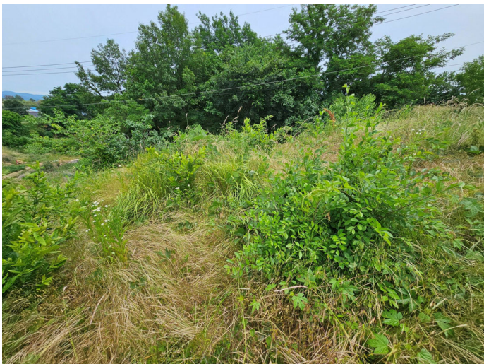
기호 (2) 서측 경계부근 분묘 2