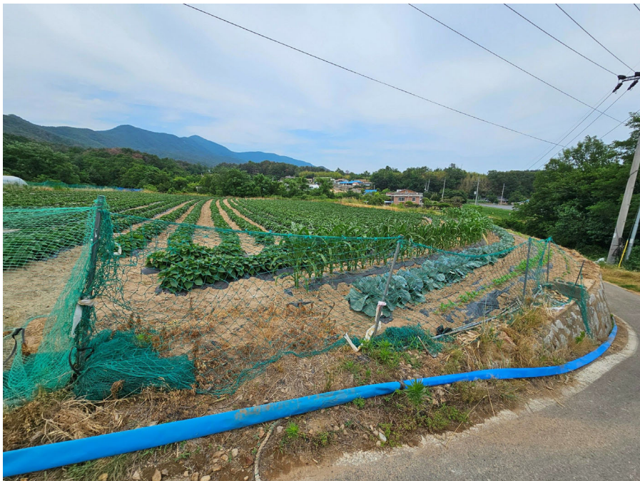
기호 (2) (남측에서 촬영)