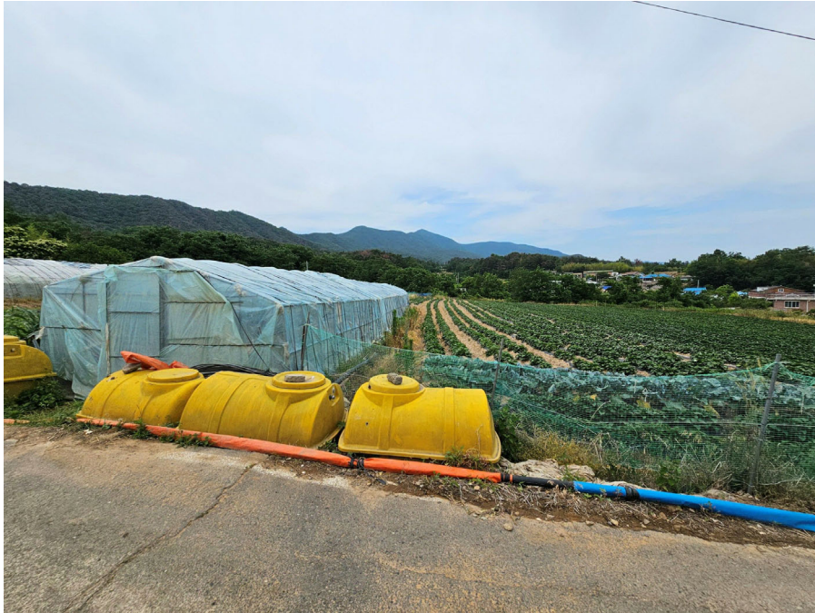
기호 (1) (남측에서 촬영)