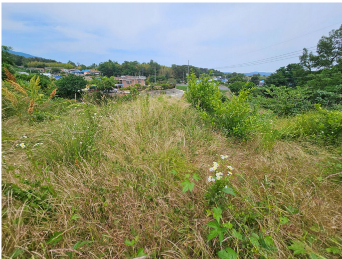
기호 (2) 서측 경계부근 분묘 1