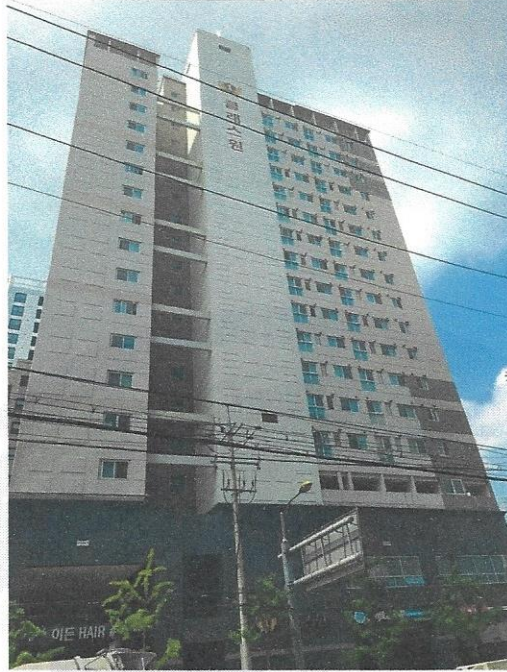
본건 전경(북측에서 남으로)