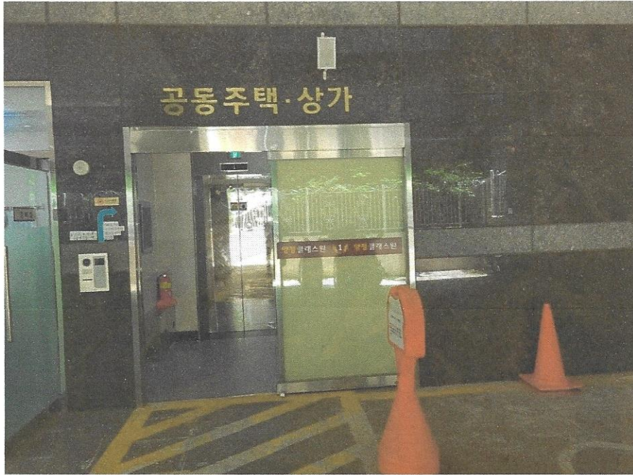
1층 공동 현관기