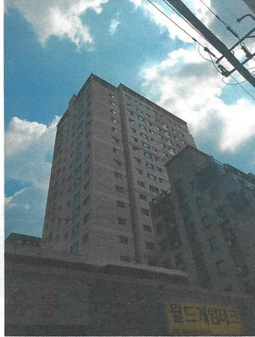
본건 전경(남서에서 북동으로)