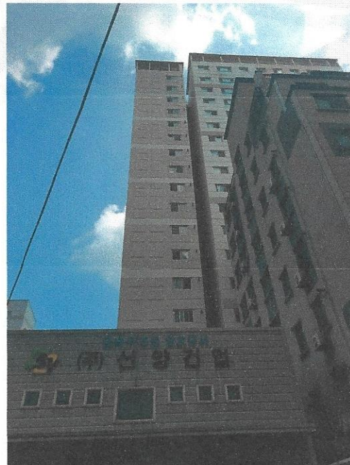
5호 라인(남서에서 북동으로)