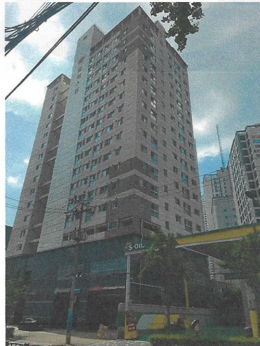
본건 전경(북서에서 남동으로)