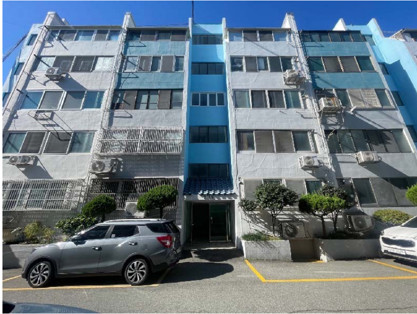
【본건 건물 근경】