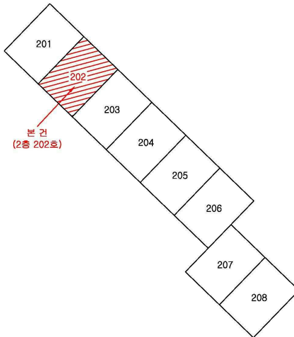
< 현대아파트 209동 2층 호별 배치도 >

부산광역시 부산진구 양정동 458-20 현대아파트 209동 2층 202호