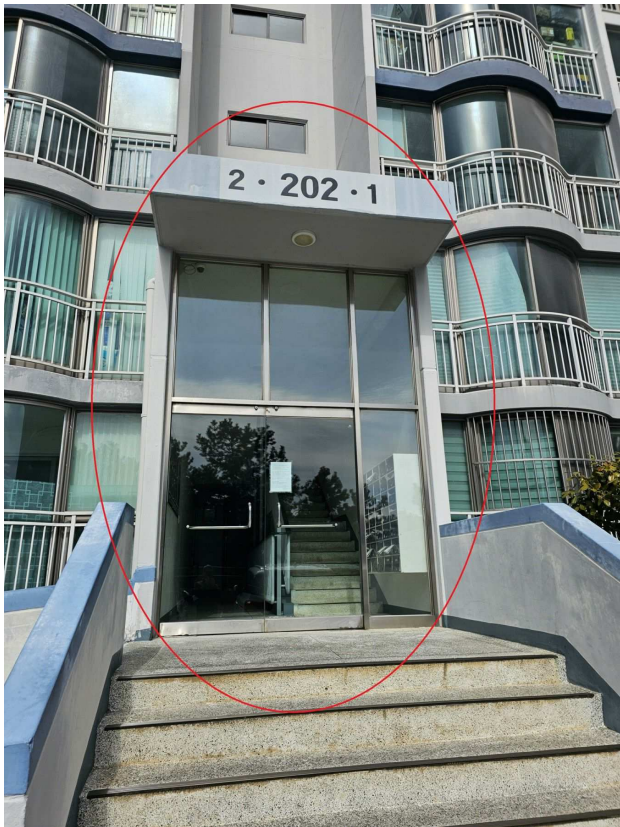
본건 공동 현관