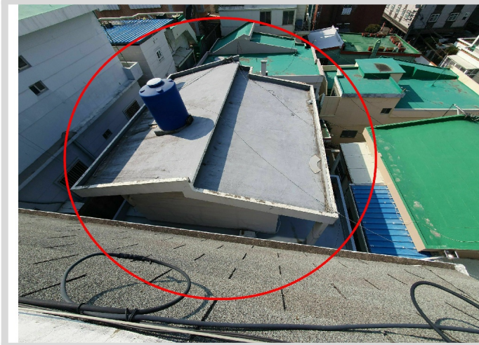
- ( )