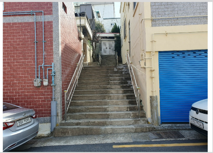
- ( )