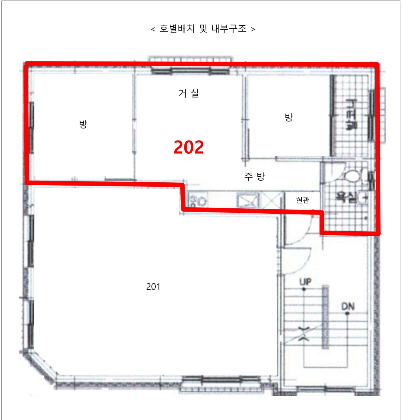
< 호별배치 및 내부구조 >