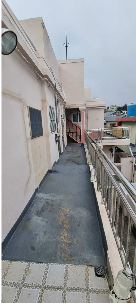
본건 2층 전경