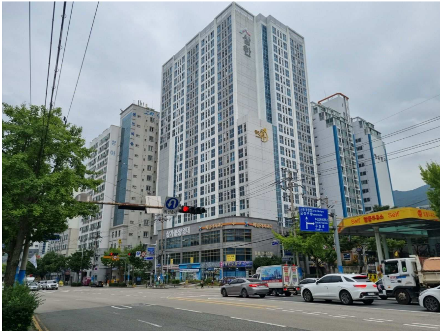
본건전경 및 주위환경