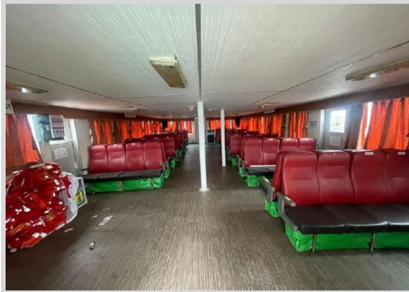
본건 내부 2층