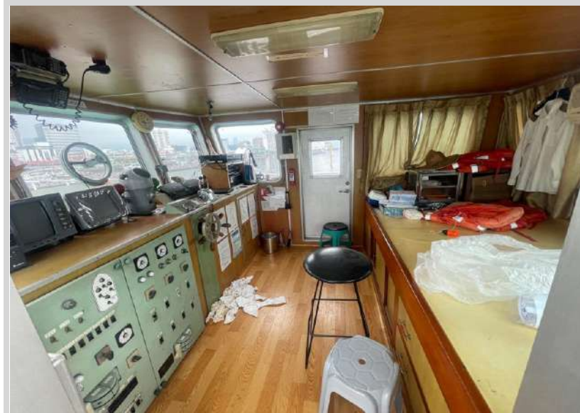
본건 내부 3층