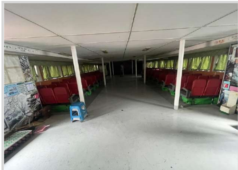
본건 내부 1층