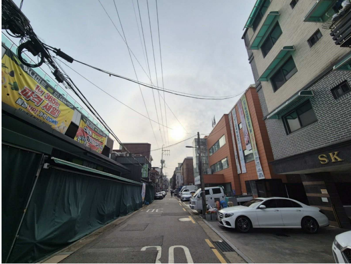
서측에서 촬영한 접면도로 및 주위환경