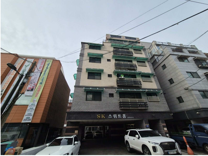
북측에서 촬영한 본건 소재 건물 전경