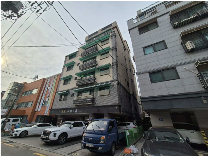
북서측에서 촬영한 본건 소재 건물 전경