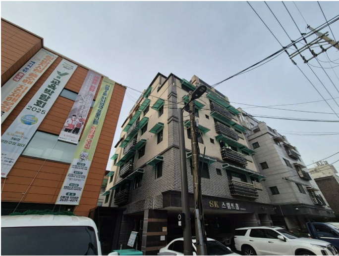
북동측에서 촬영한 본건 소재 건물 전경