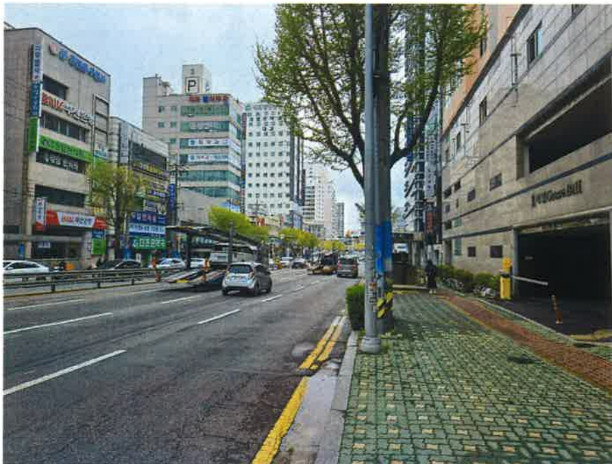
접면도로 및 주위환경