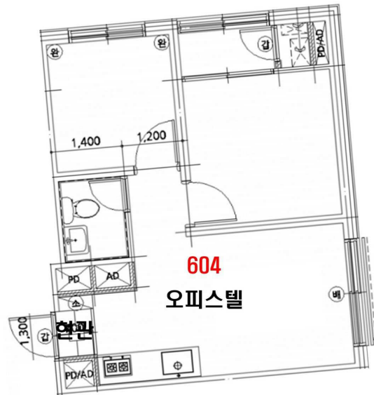
< 내부구조도 >