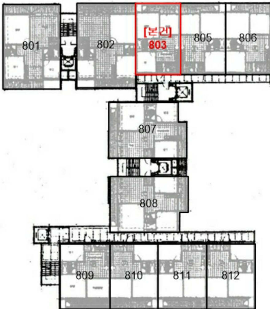
[동삼동삼창그린타운 제102동 제8층 호별배치도]