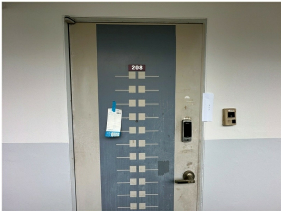
( 208 )