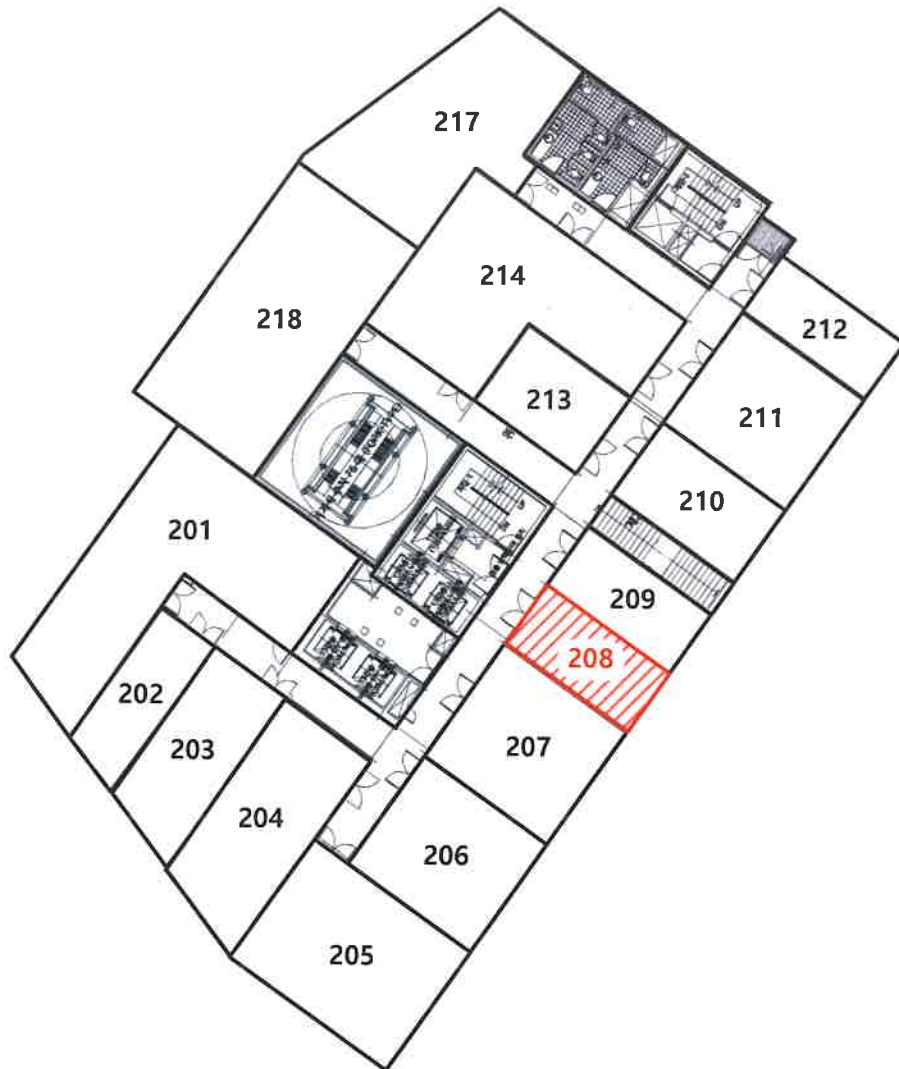
라마다양코르해운대호텔 2층 208호 호별배치도