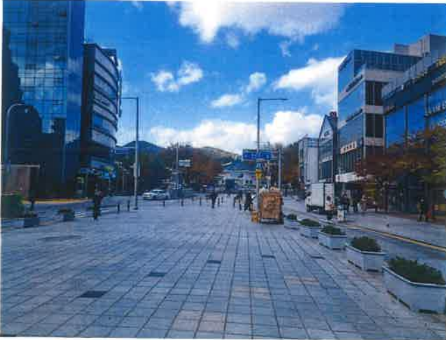
접면도로 및 주위환경