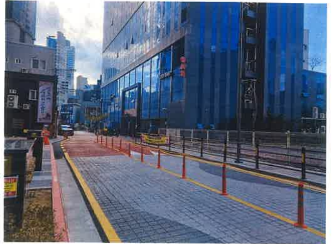
접면도로 및 주위환경