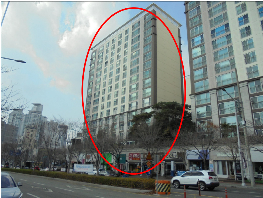
북동측 → 남서측