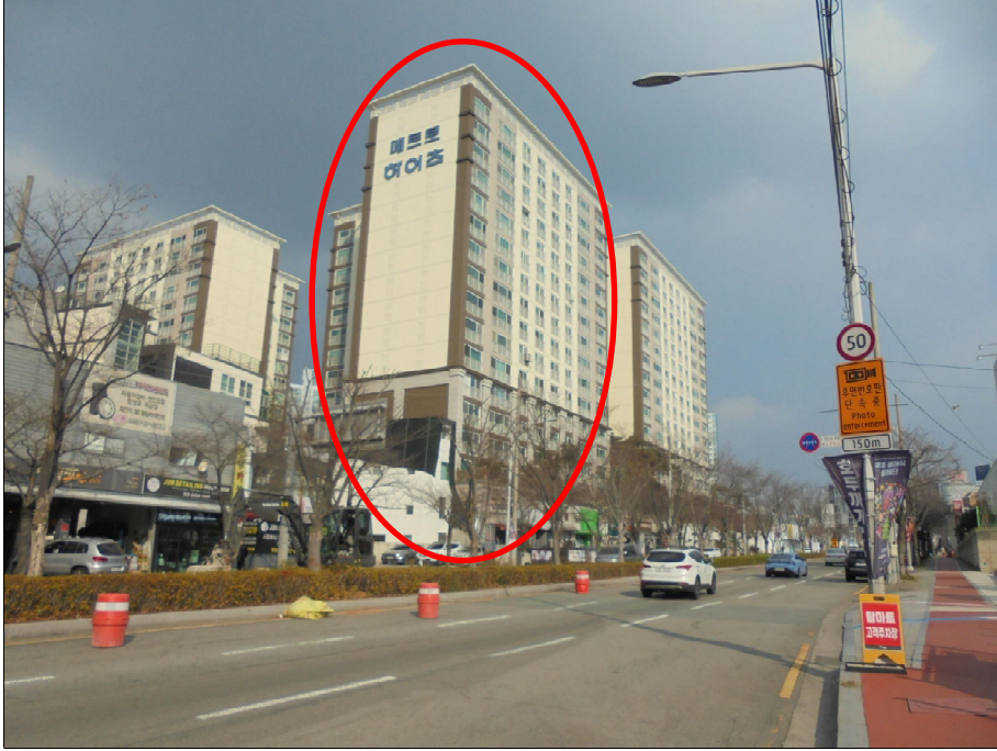
남측 → 북측