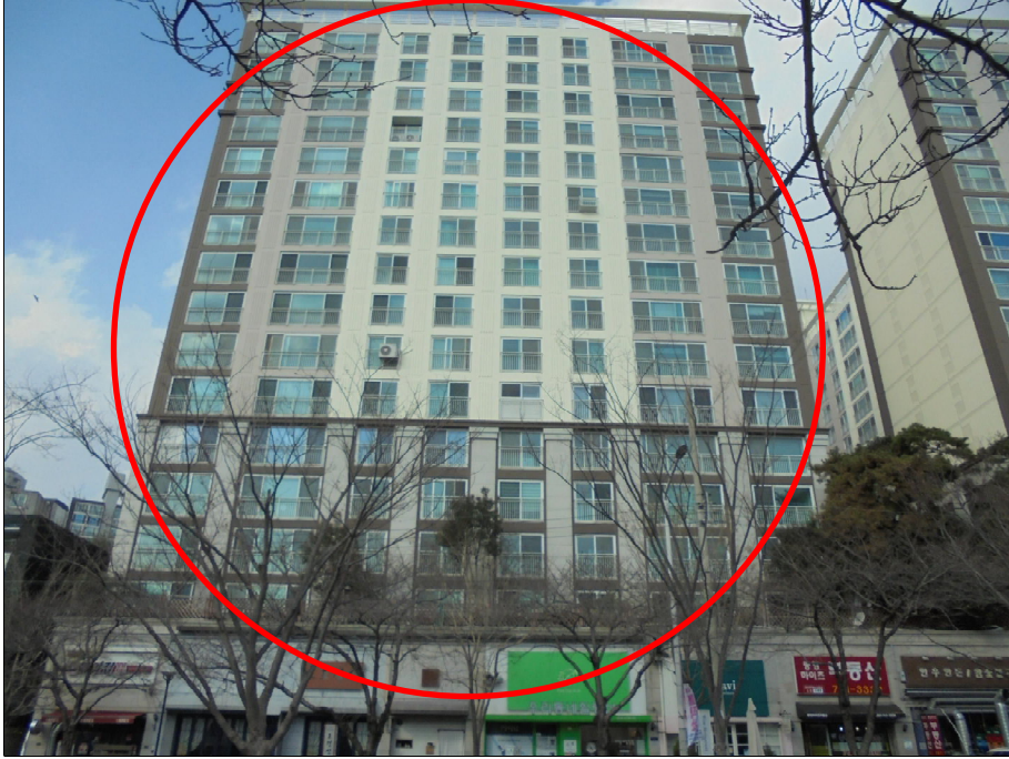
남동측 → 북서측