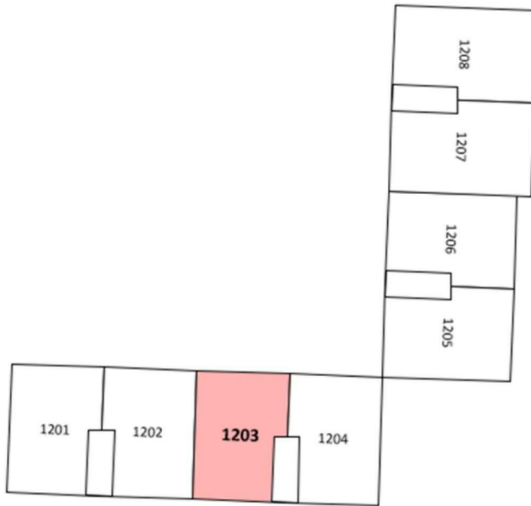
현대한누리타운 101동 12층 호별배치도