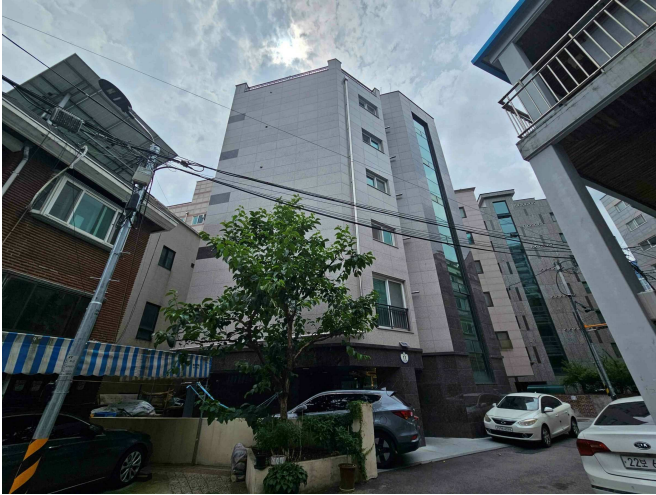
본건 소재 건물 전경