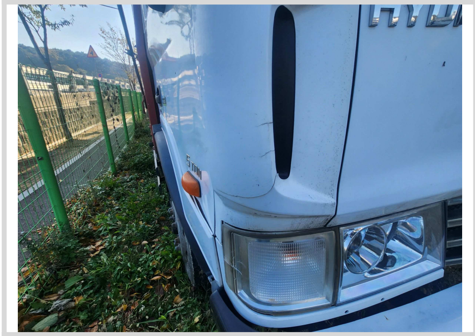
스크래치 및 흠집