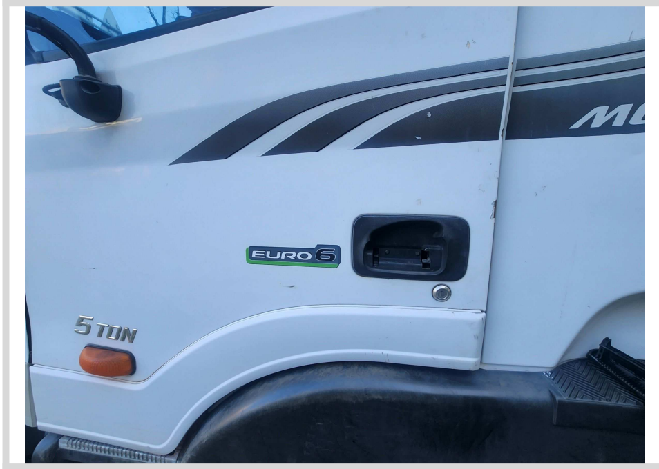
운전석 손잡이 파손