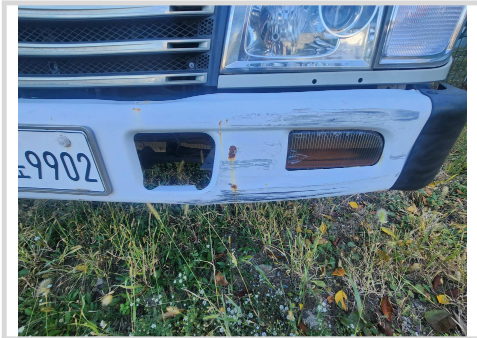
스크래치 및 흠집