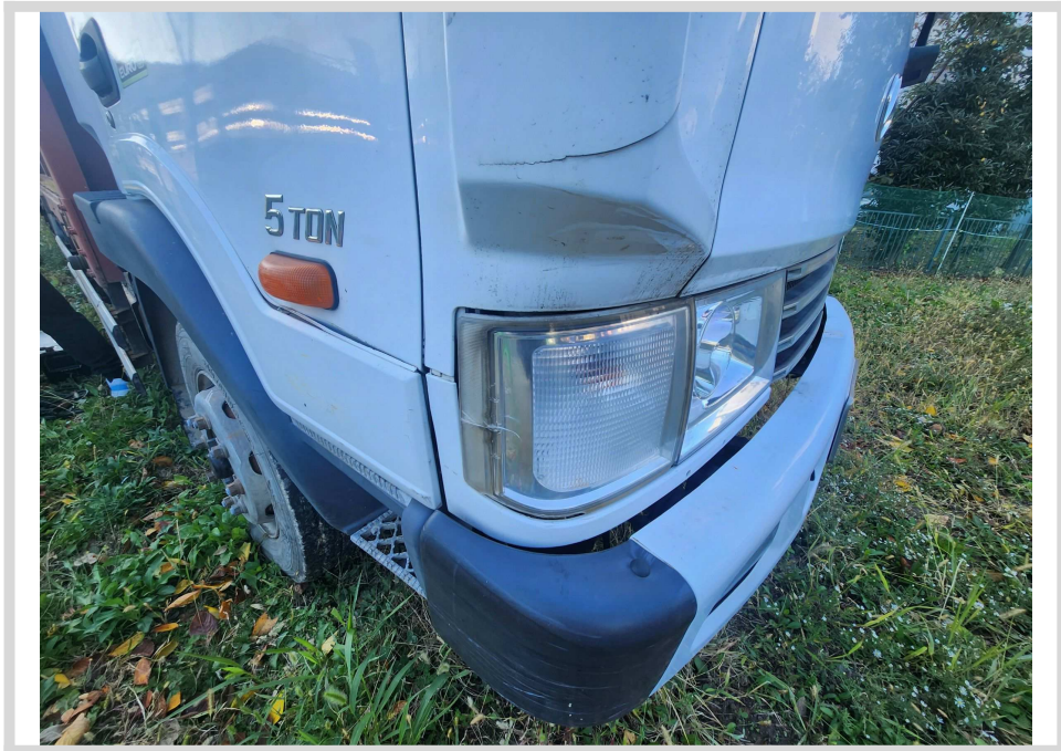
스크래치 및 흠집