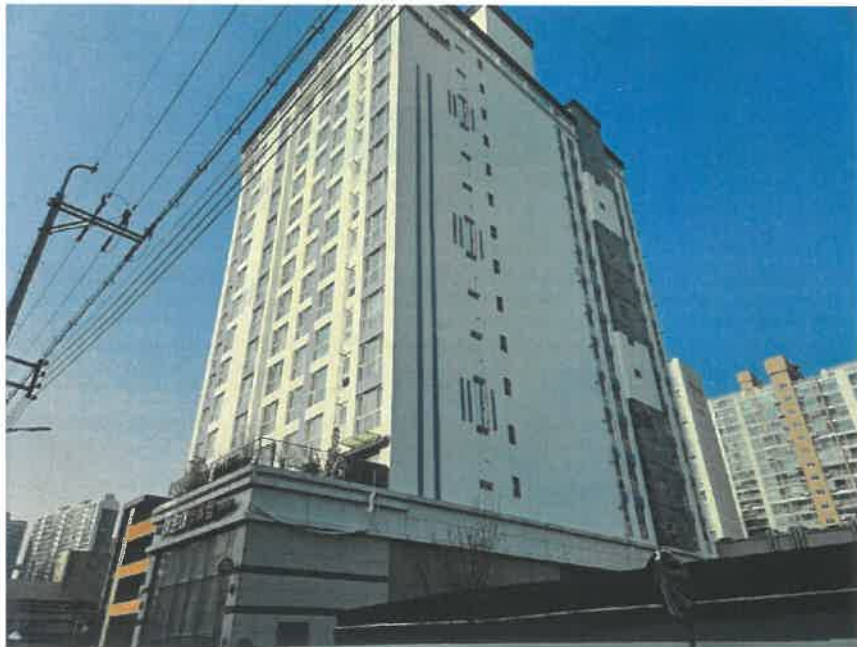
본건 외부 전경