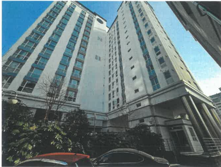
본건 외부 전경