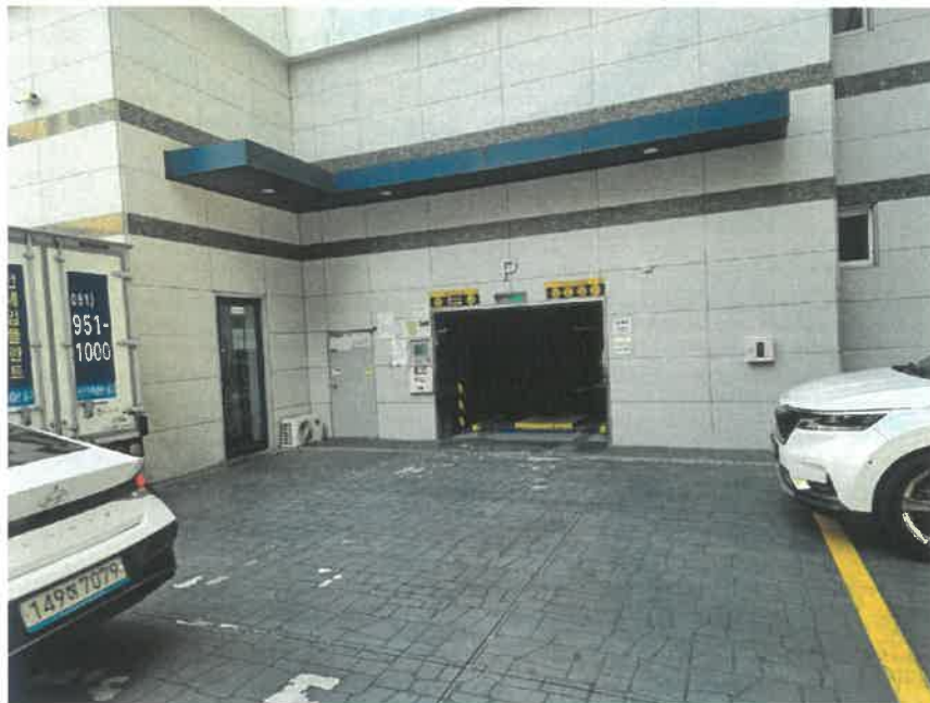
본건 타워주차장 출입구