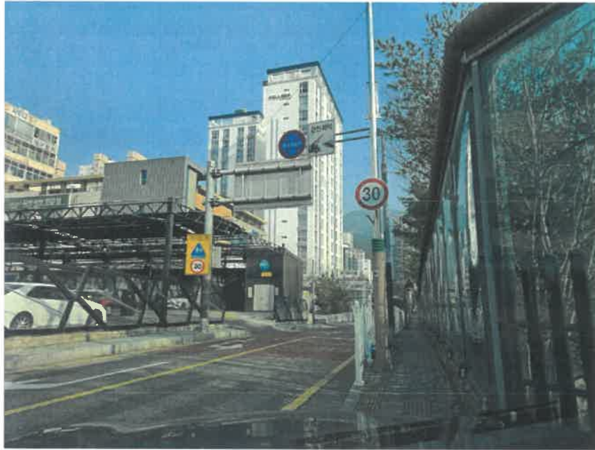
본건 주위 환경