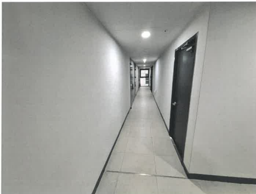
본건 11층 복도