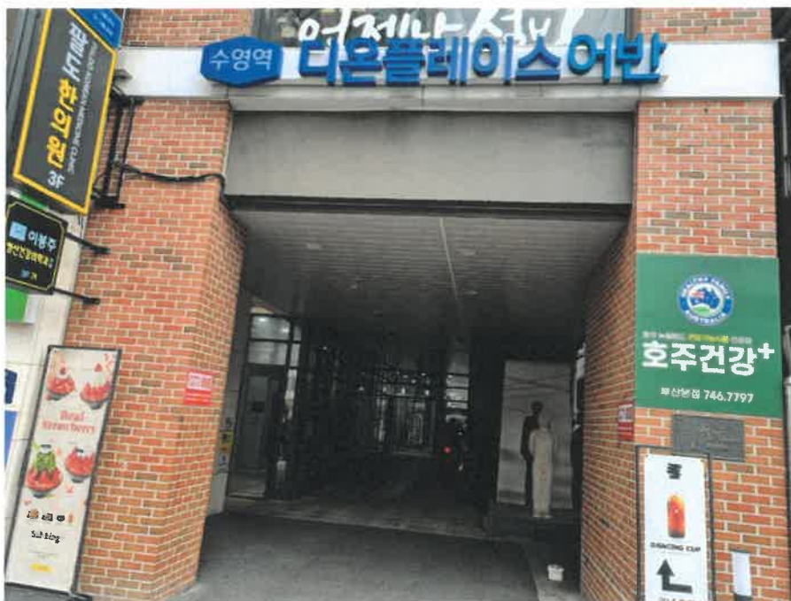
본건 1층 공동출입구