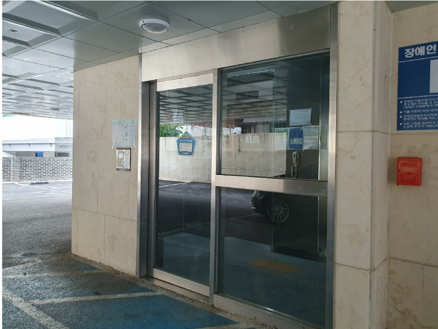
1 ( )