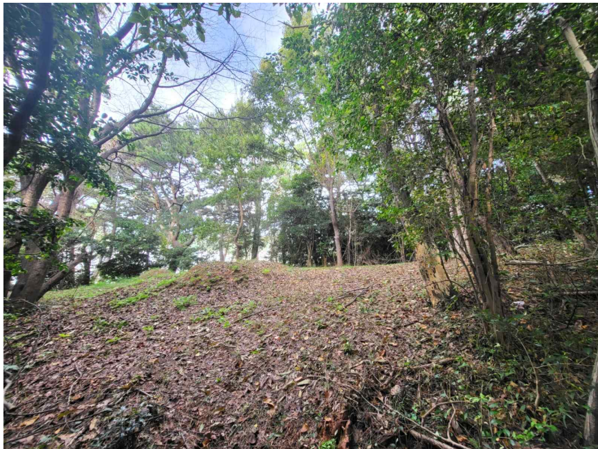
본건 및 주위환경