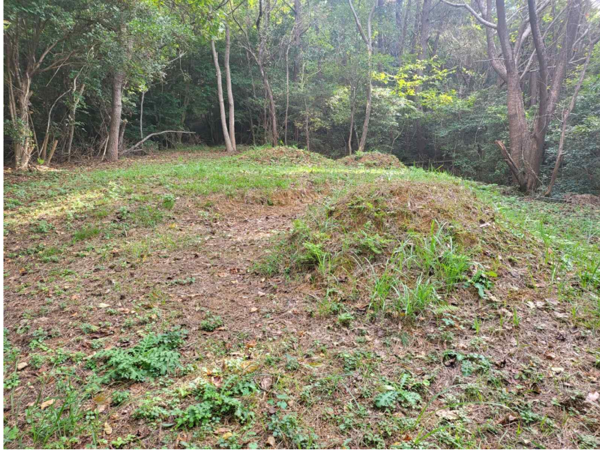
본건 이용상황(분묘 소재)