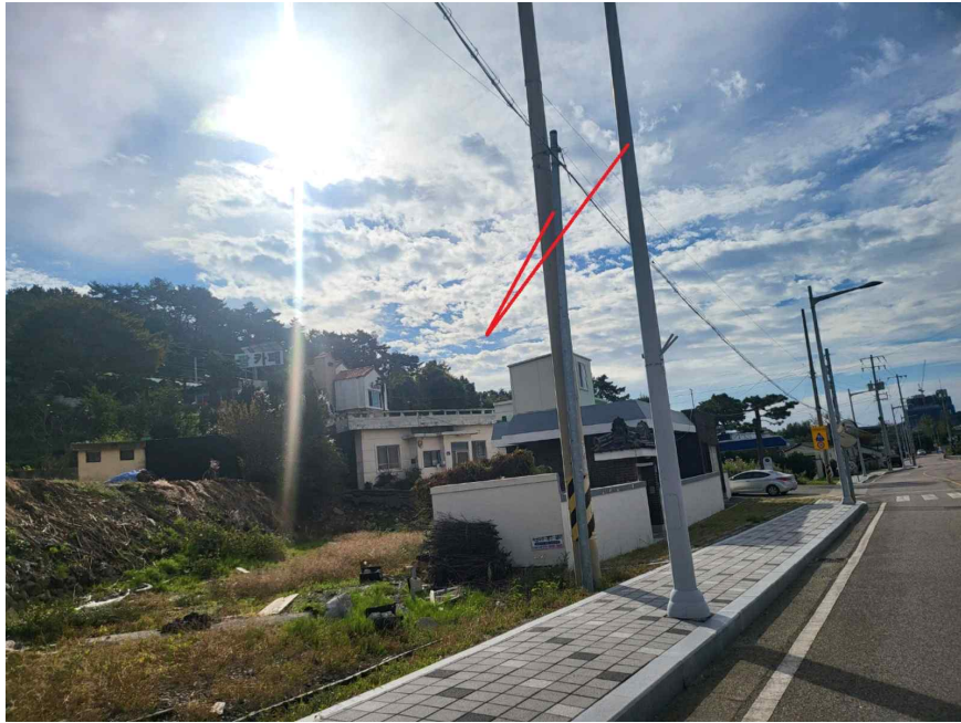
본건 및 주위환경