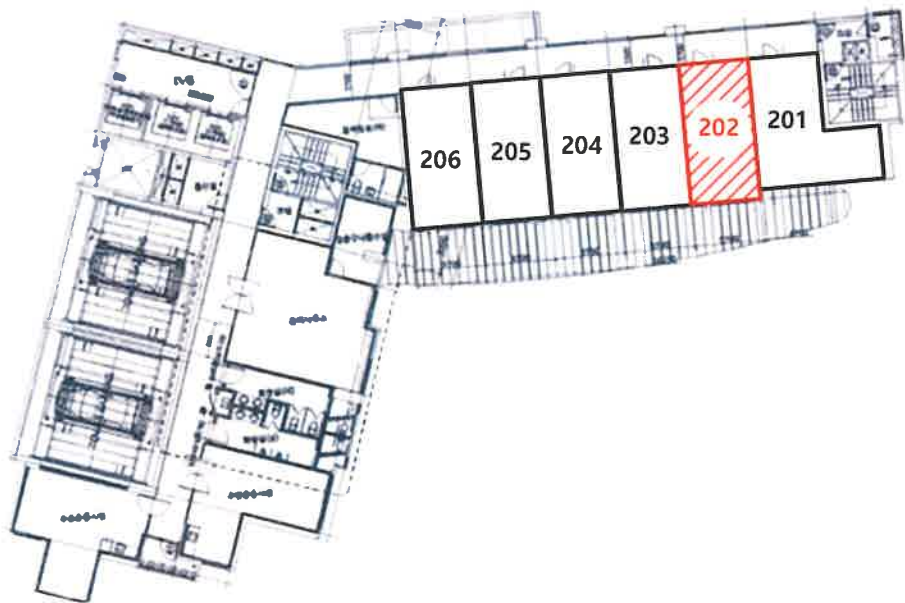
해운대U-시티오피스텔 2층 202호 호별배치도