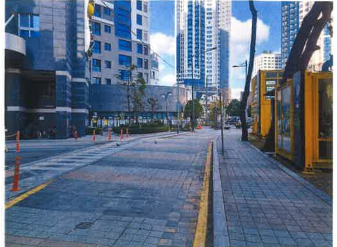
접면도로 및 주위환경