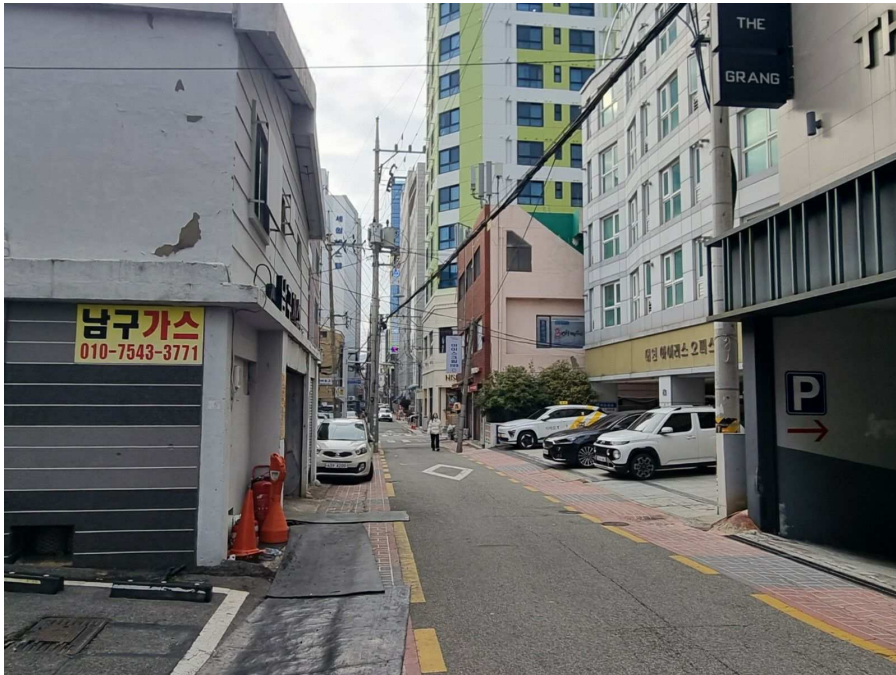
본건전경 및 주위환경