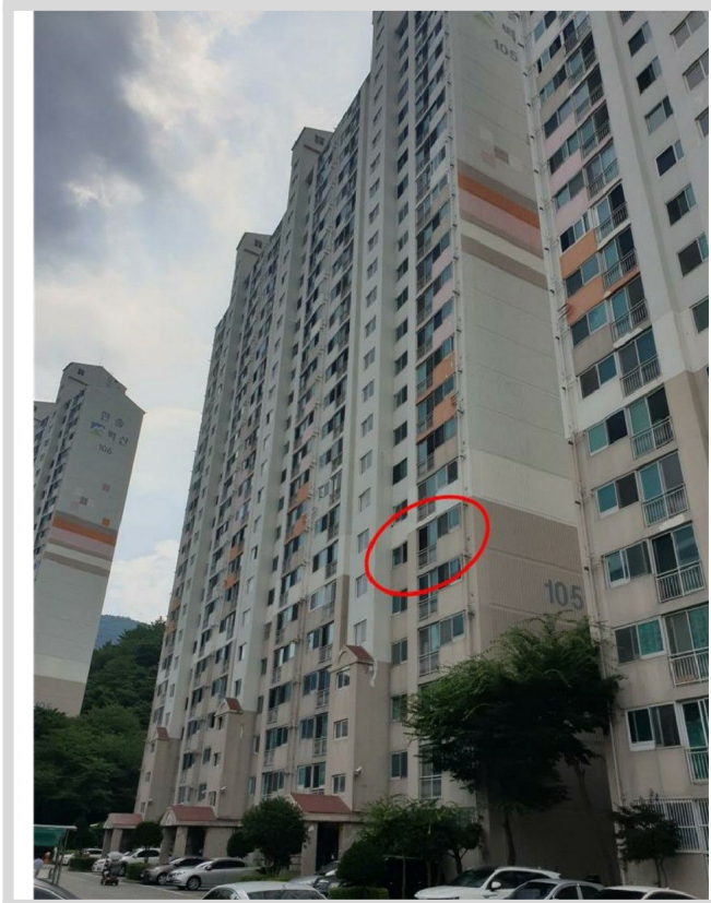
- ( )