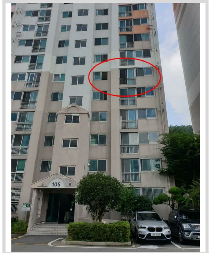
- ( )