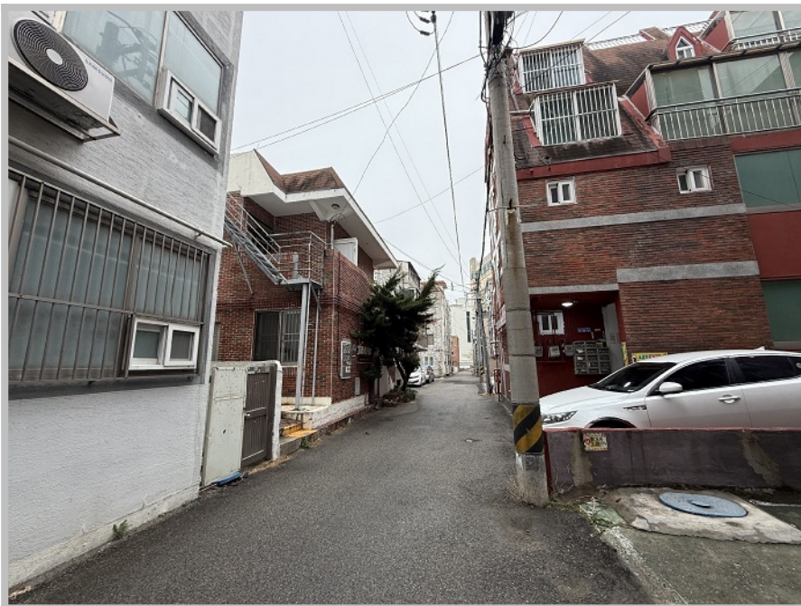
【 주위 환경 】