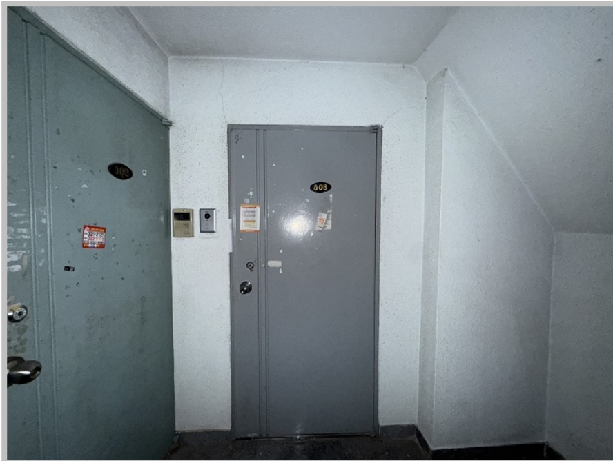
【 본건 전경 】