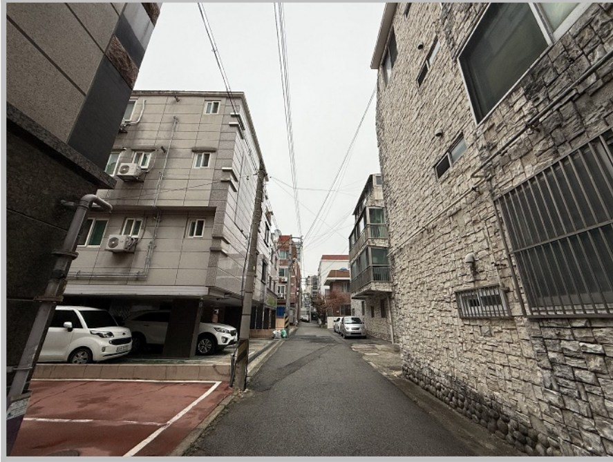
【 주위 환경 】