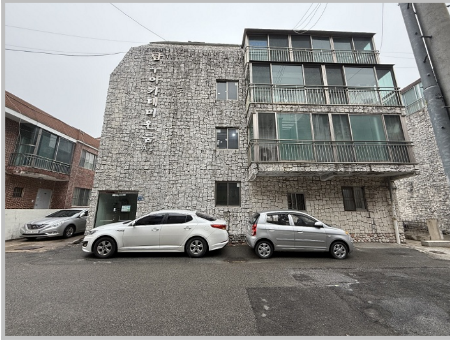
【 본건 전경 】