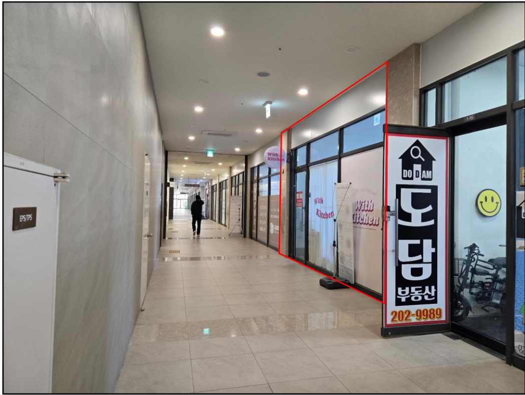
[본건 및 복도]