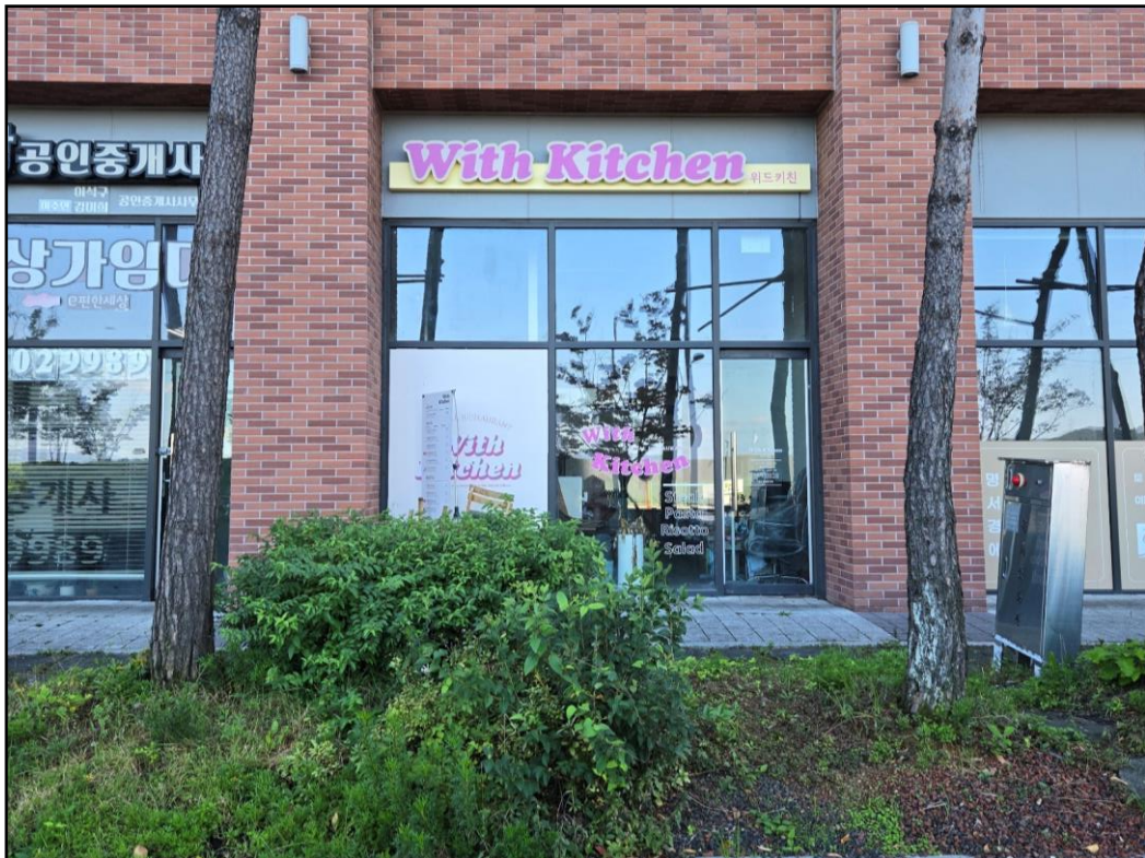
[기호(가): 본건 전경 (전면도로측)]