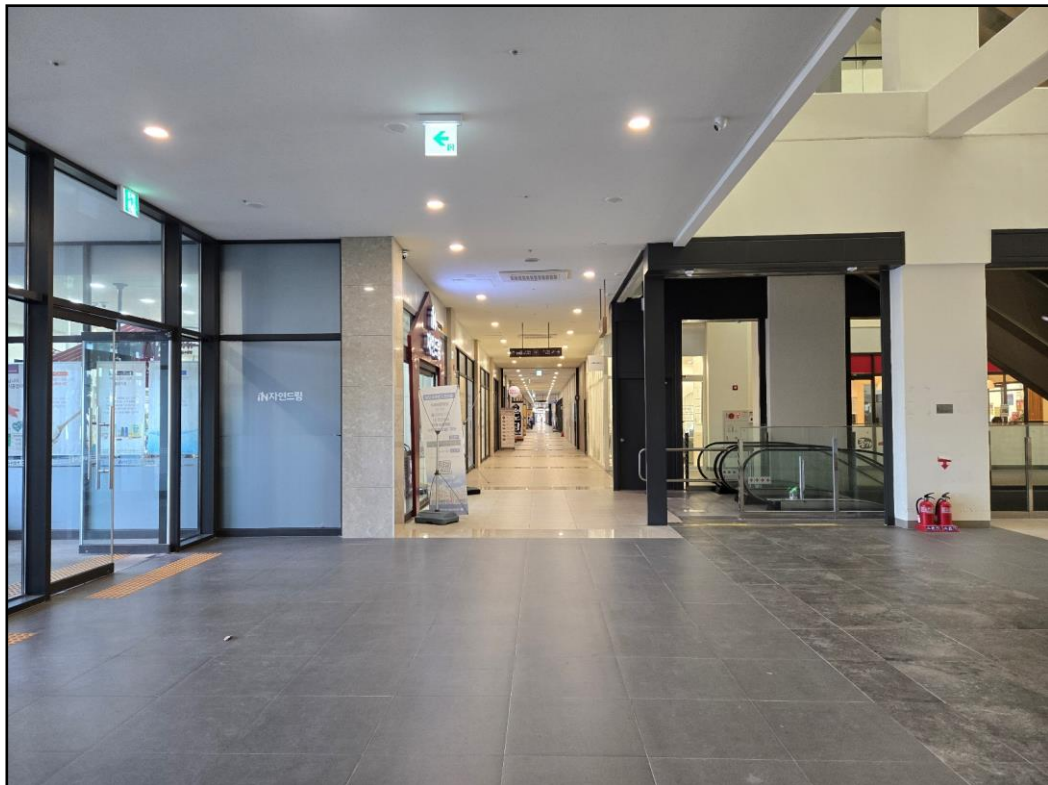
[1층 상가 복도]