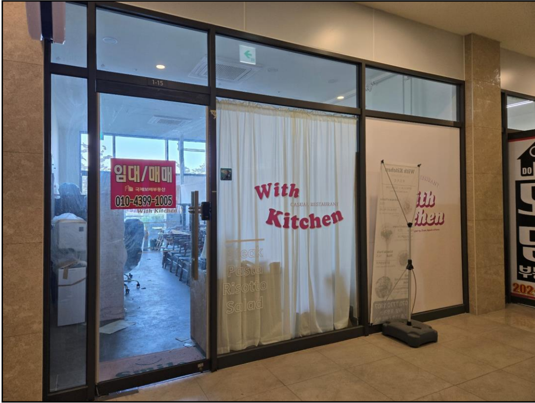
[기호(가): 본건 전경 (복도측)]