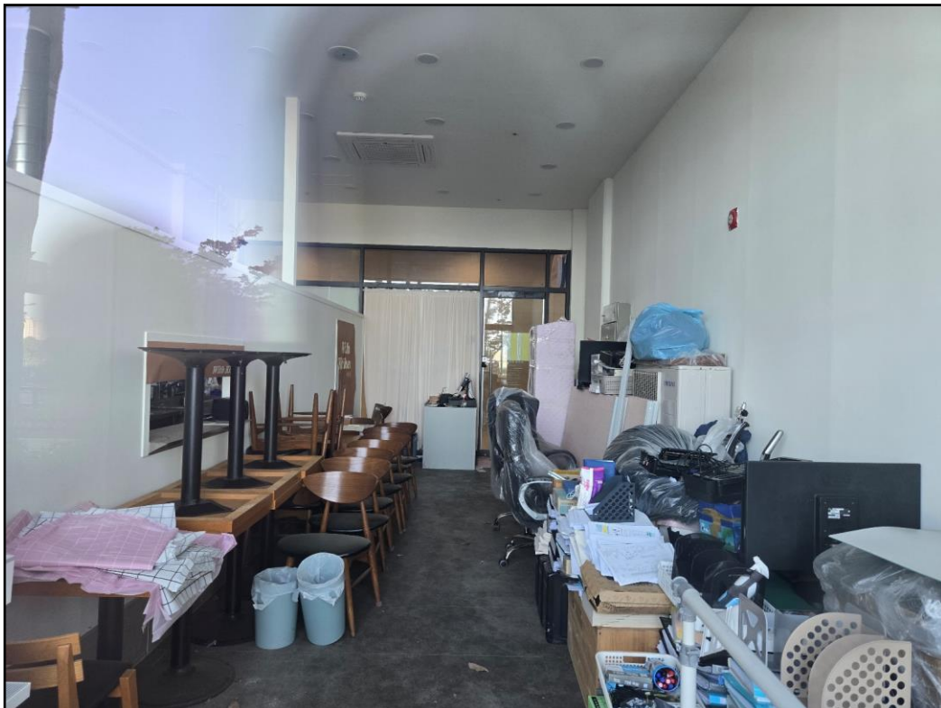
[기호(가): 본건 내부]