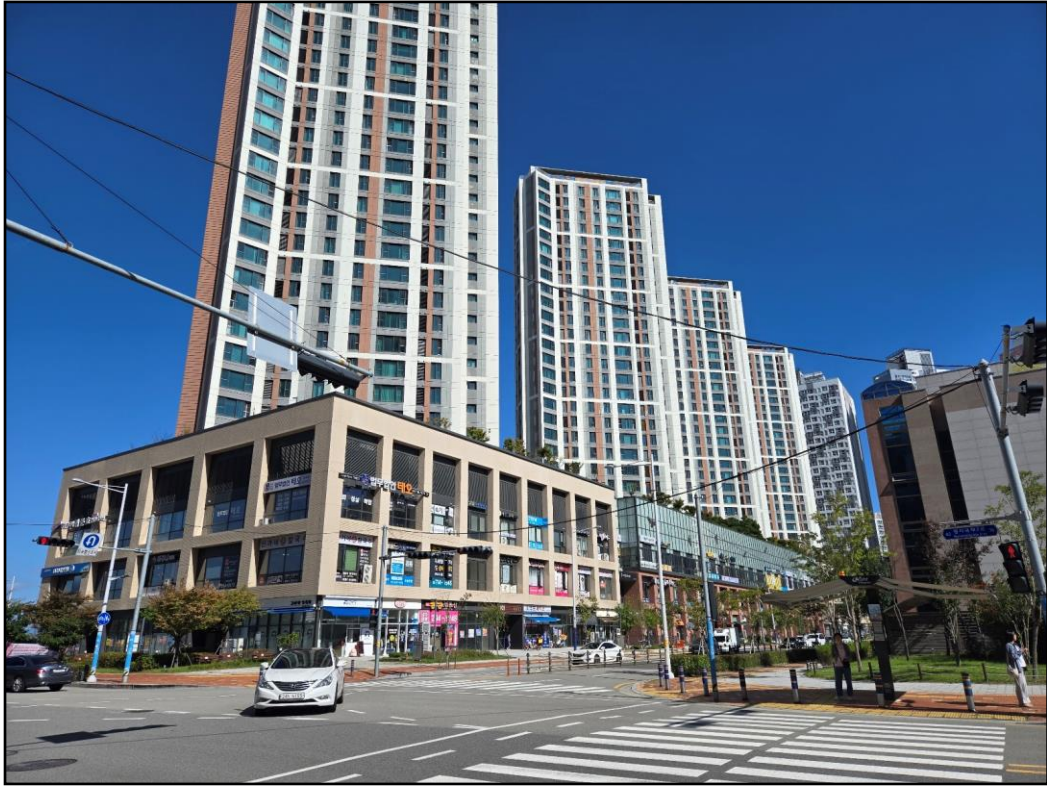
[본건(이편한세상 명지 비주거시설동) 전경 (남서 → 북동)]