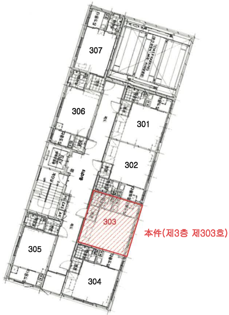
< 대박힐링오피스텔 제3층 배치도 >