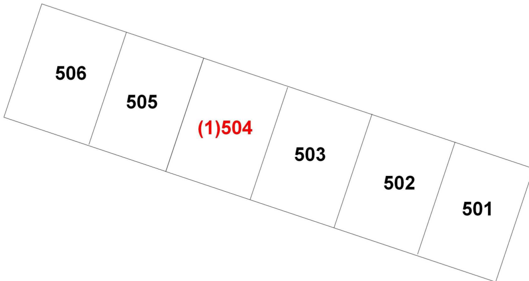
금곡동 56-1 벽산,삼협한솔아파트 105동 5층 호별배치도