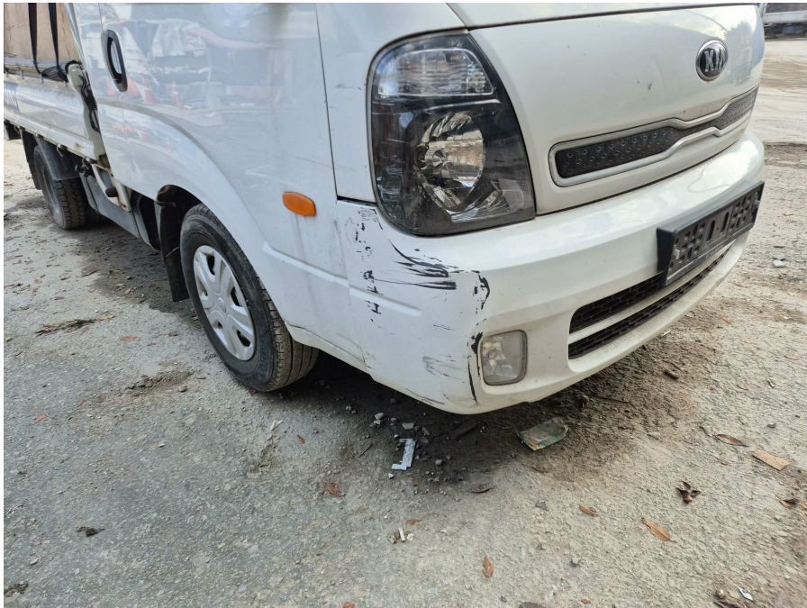
본건 전면부 및 측면