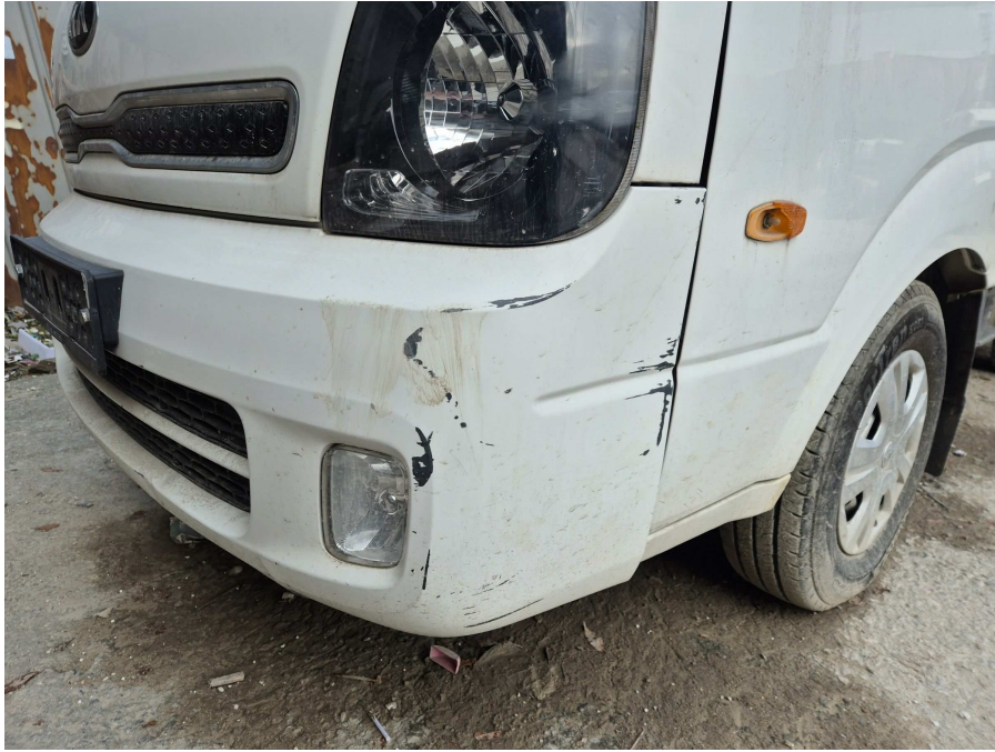
본건 전면부 및 측면