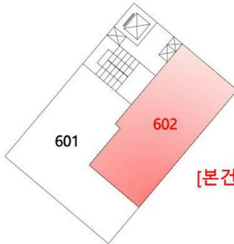
[본건 6층 602호]