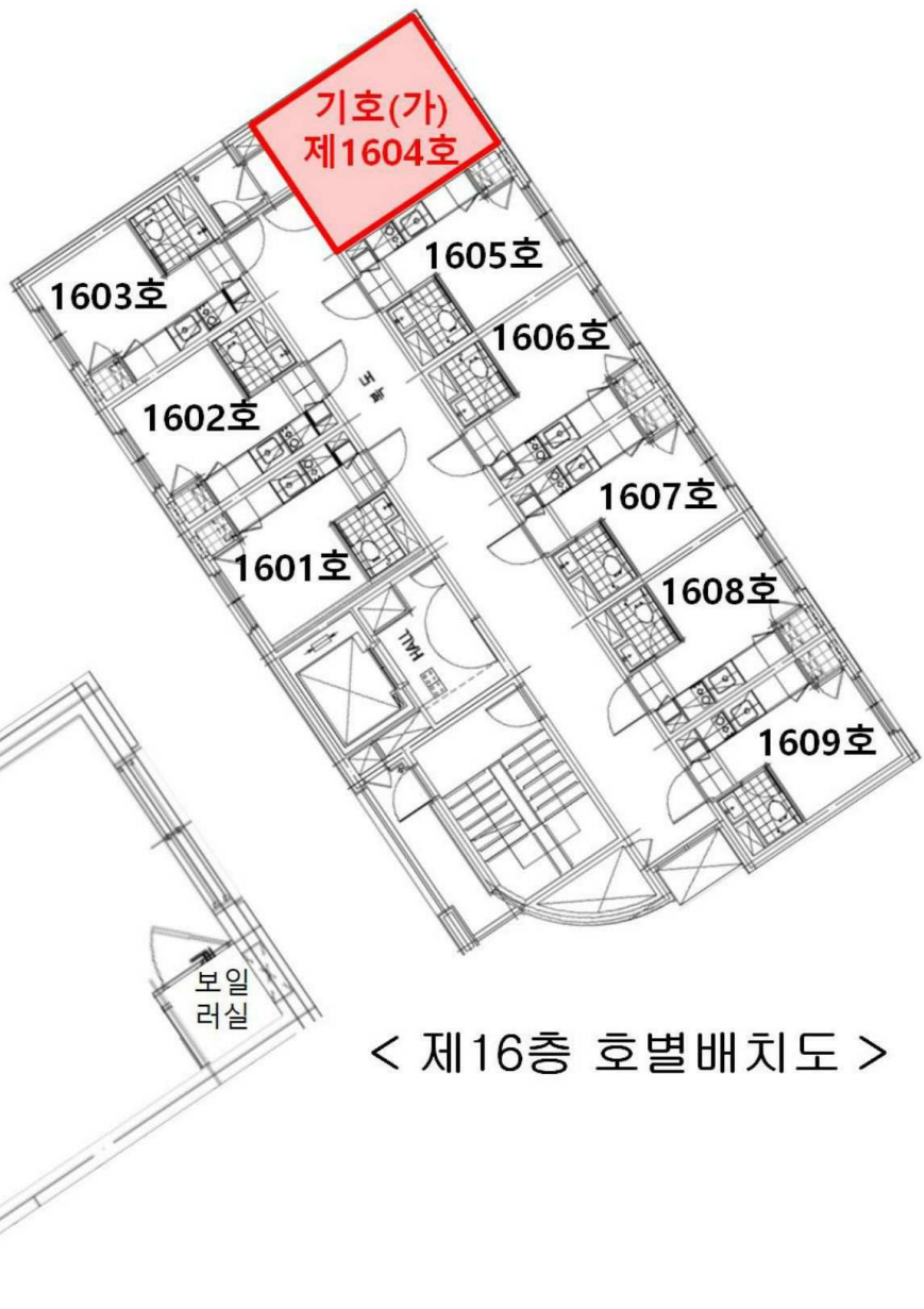
< 제16층 호별배치도 >