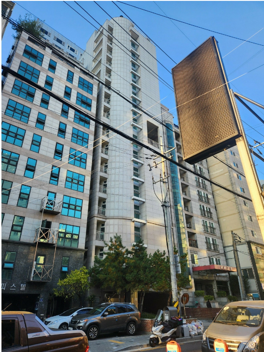
[ 1 ]