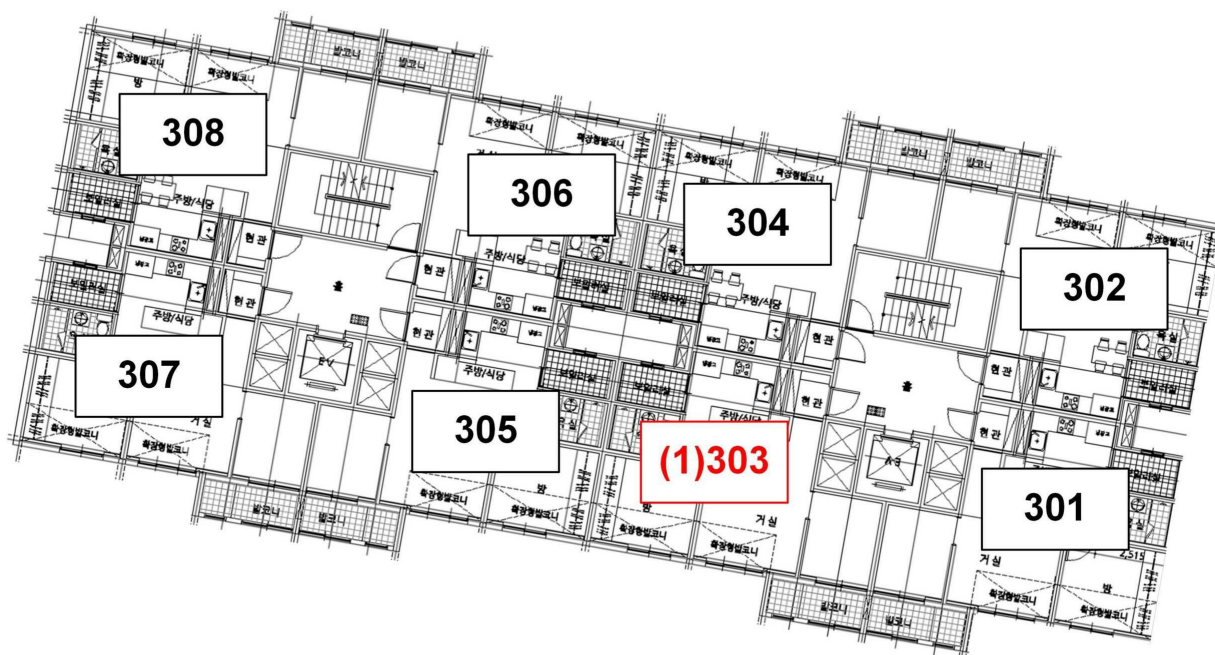
하단동 1218, 건우리안 에이동 3층 호별배치도