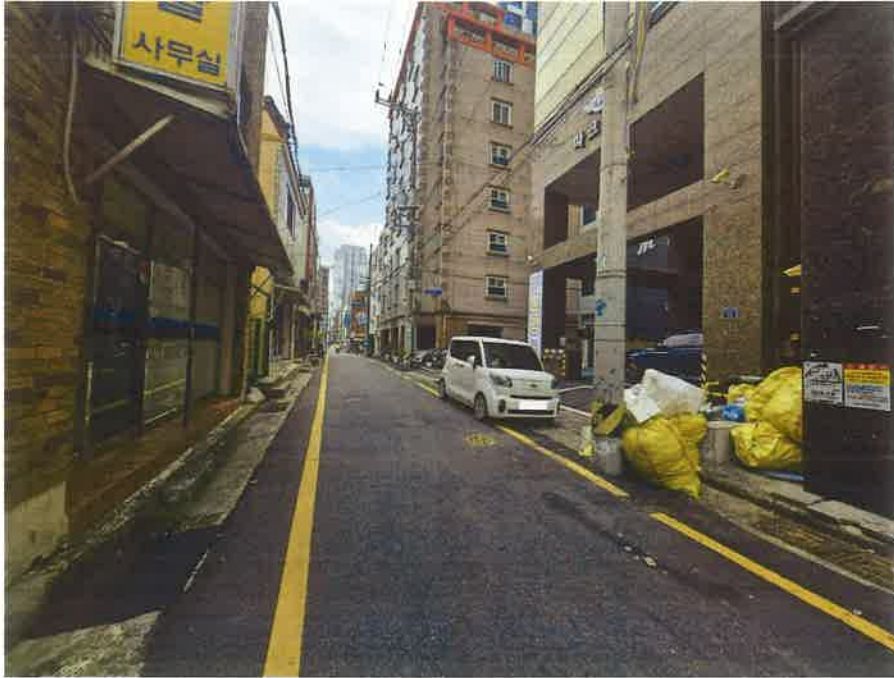
접면도로 및 주위 환경