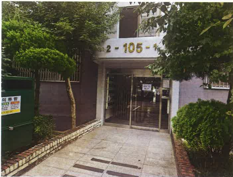
105동 1,2호라인 공동출입구