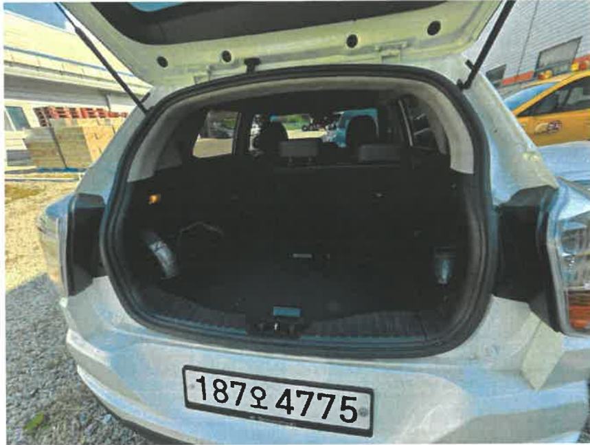
본건 트렁크 후문