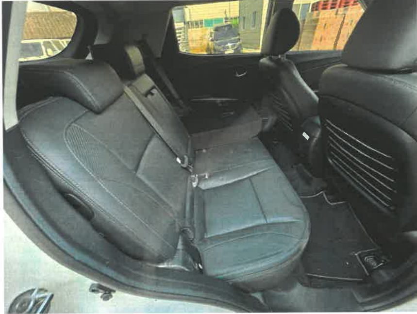
본건 내부 후면