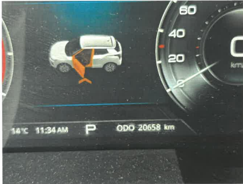
본건 계기판 총주행거리 20,658km