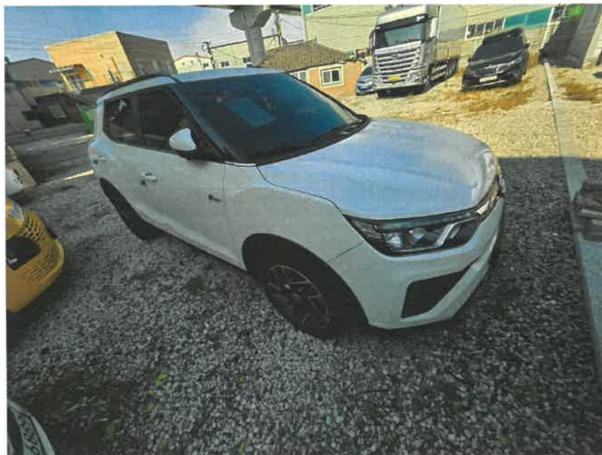
본건 우측 전면