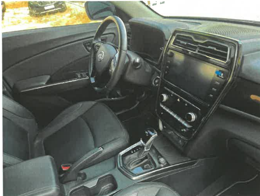
본건 내부 전면