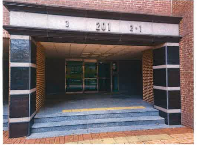
201동 1,2,3호라인 공동출입구