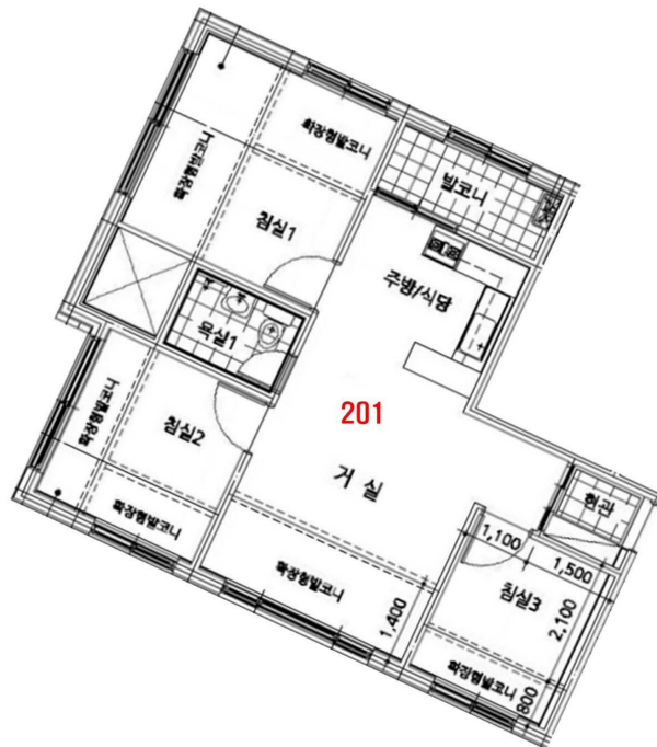
< 내부구조도 >