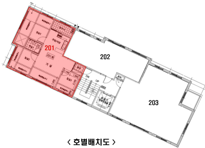
< 호별배치도 >