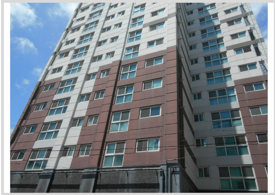
[ : 10 1001 ]