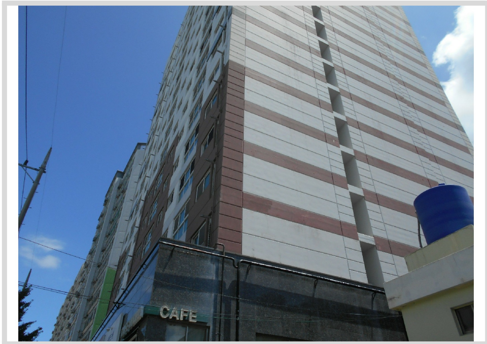
[ ( ) ]