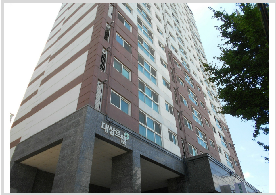
[ ( ) ]