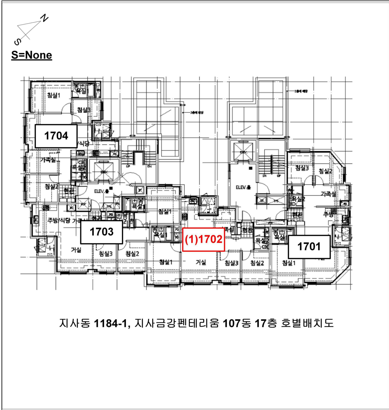
지사동 1184-1, 지사금강펜테리움 107동 17층 호별배치도