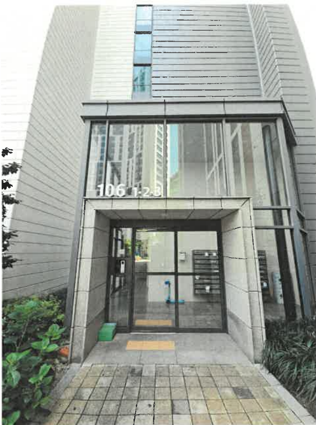
본건1층 소재 공동현관기