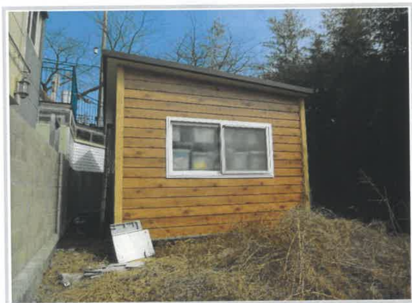
제시외건물 기호 ㉔ 전경