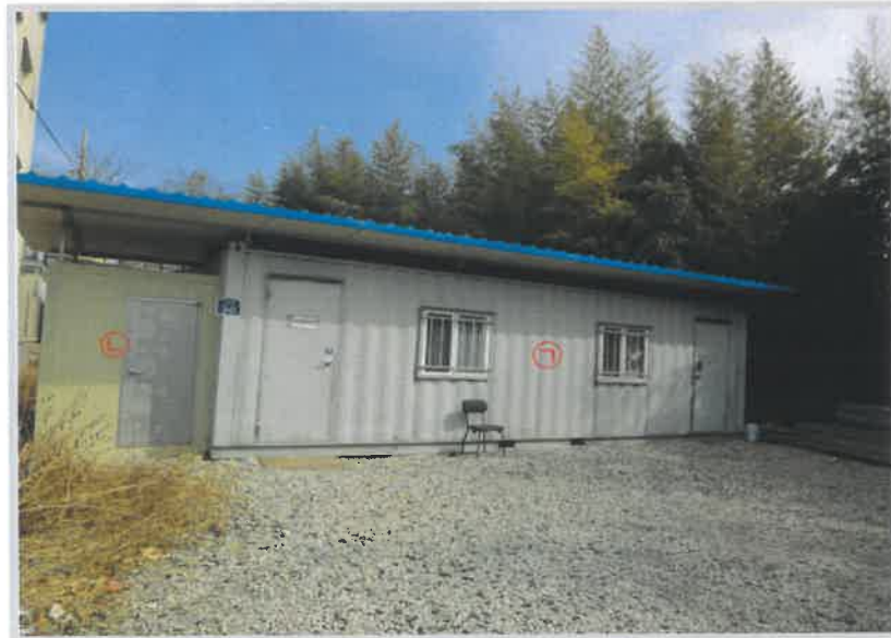
제시외건물 기호 ㉠,㉡ 전경